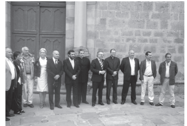
Foto de familia en la inauguración del museo de Urdax.