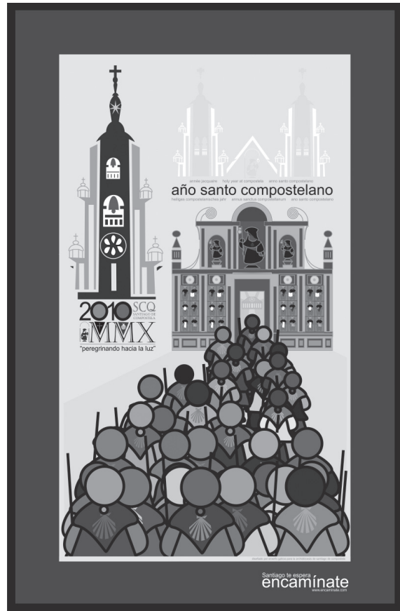
Cartel anunciador del Año Santo Compostelano 2010.