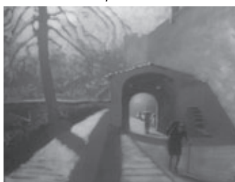
1 er premio