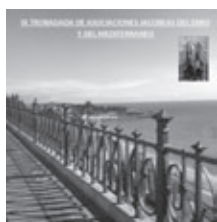
IX encuentro jacobeo del ebro y mediterraneo.

22:30 horas. Visita guiada por la Parte Alta de TARRAGONA (ILUMINACIÓN NOCTURNA DE LAS MURALLAS ROMANAS, ANFITEATRO, CATEDRAL).