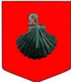
Asociación Amigos de la Colegiata de Roncesvalles